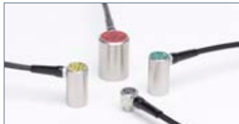
ECHOMETER 1076 TC 對應各種測量的探頭