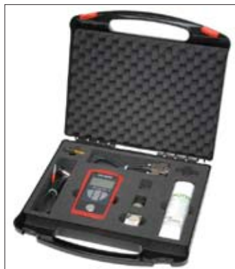
隨貨附贈一個手提儀器箱